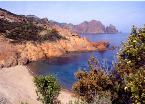
PNR de Corse