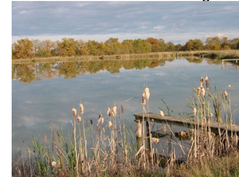
PNR de Brière