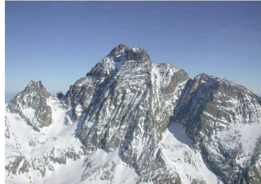
PNR du Queyras