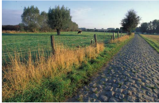
PNR Scarpe- Escaut