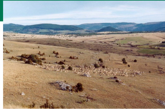
PNR des Grands Causses