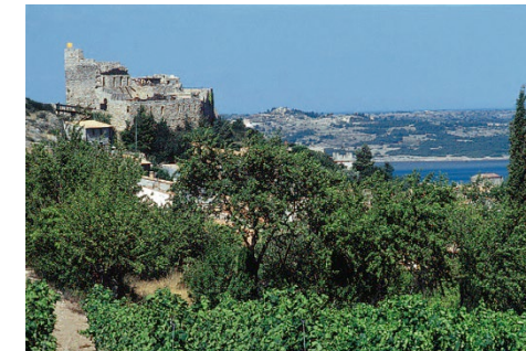
PNR de la Narbonnaise en méditerranée