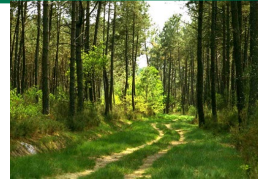
PNR des Landes de Gascogne